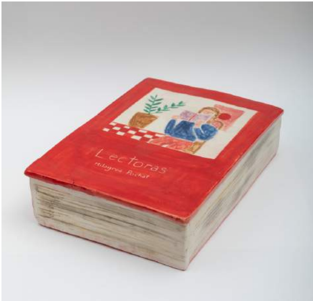
LIBRO Cerámica esmaltada 200 USD