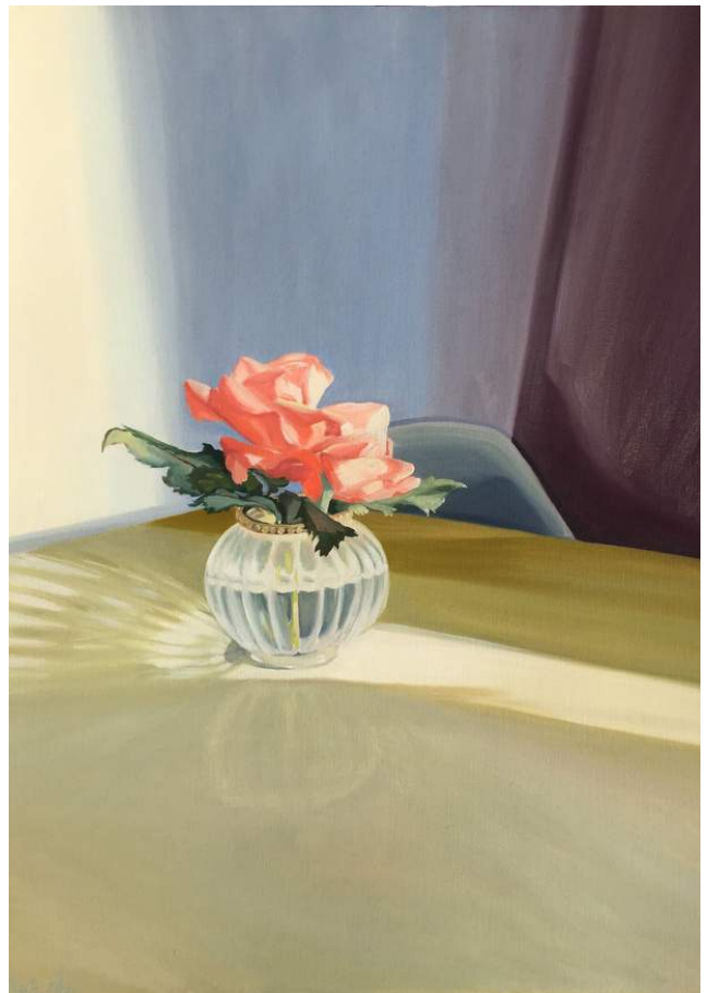
EL AURA DE LAS FLORES II Óleo sobre papel, enmarcada. 65 x 50 cm 2022 USD 400