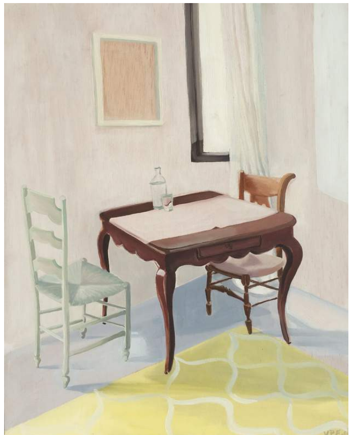
EL CUCO Óleo sobre madera 41 x 33 cm 2020 USD 300