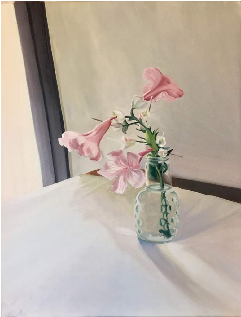
EL AURA DE LAS FLORES III Óleo sobre papel, enmarcada. 65 x 50 cm 2022 USD 400