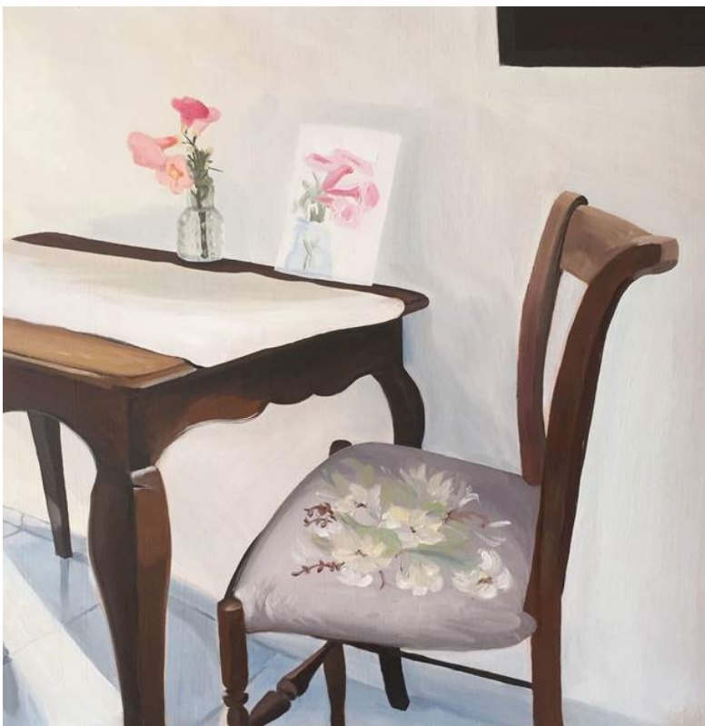
EL CUCO II Óleo sobre madera 50 x 50 cm 2020 USD 400