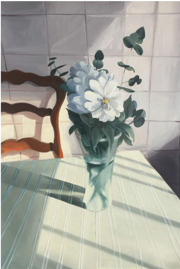
EL AURA DE LAS FLORES Óleo sobre papel, enmarcada. 65 x 50 cm 2021 USD 400