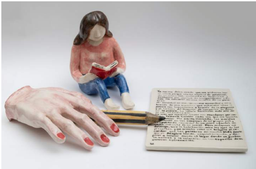
LECTORA Cerámica esmaltada 250 USD