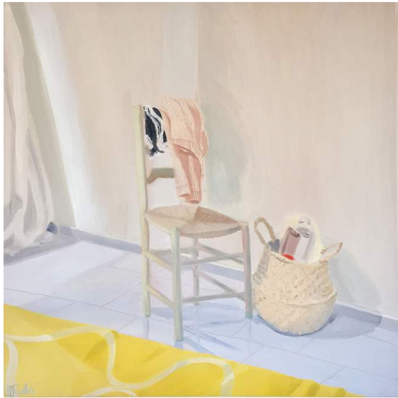
EL CUCO III Óleo sobre madera 40 x 40 cm 2020 USD 300