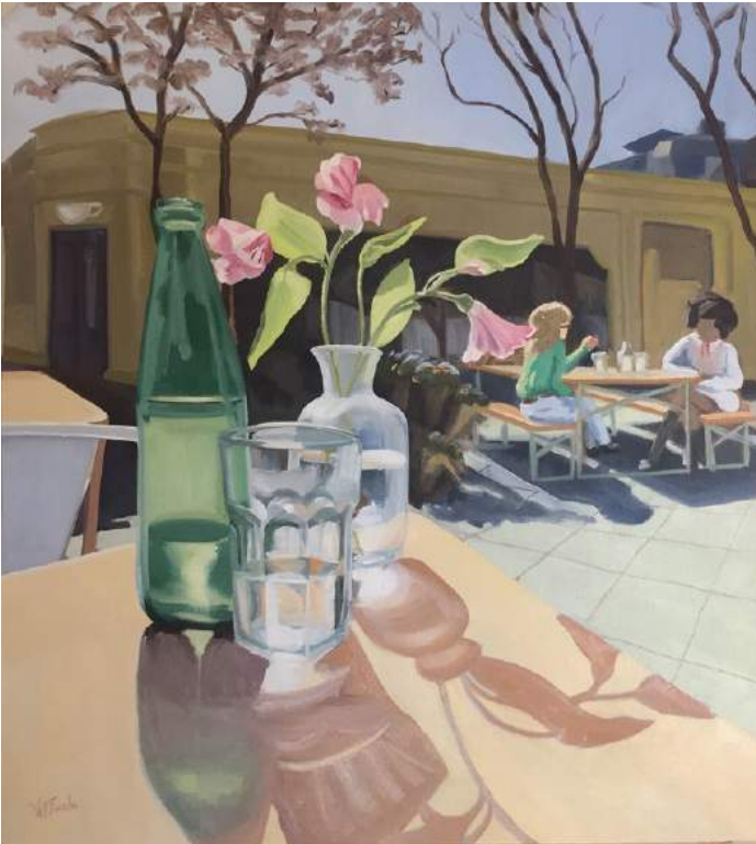
VEREDITA PORTEÑA Óleo sobre papel, 55 x 50 cm 2022 USD 400