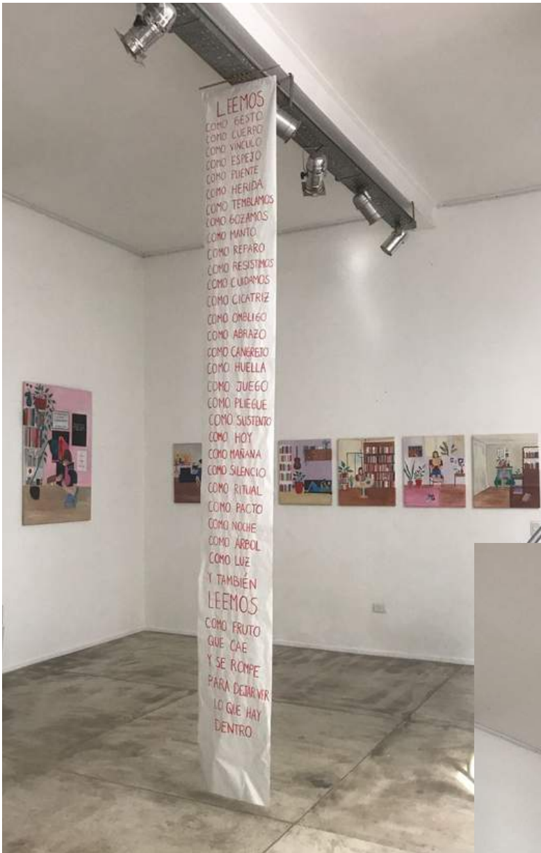
LEEMOS (Poema) Papel pintado a mano con acrílico 200 USD