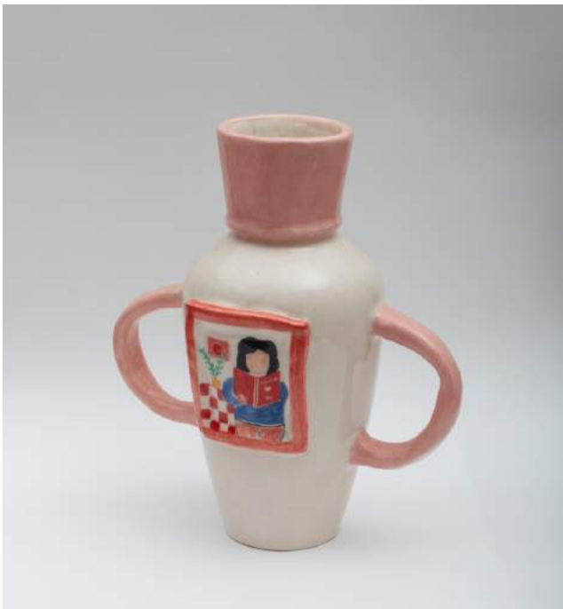
JARRÓN Cerámica esmaltada 180 USD