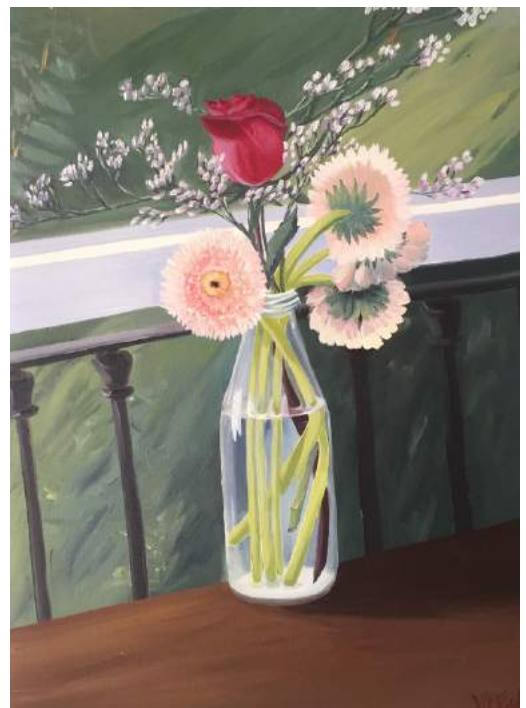
FLORES DE BIENVENIDA Óleo sobre papel, enmarcada. 30 x 40 cm 2020 USD 300